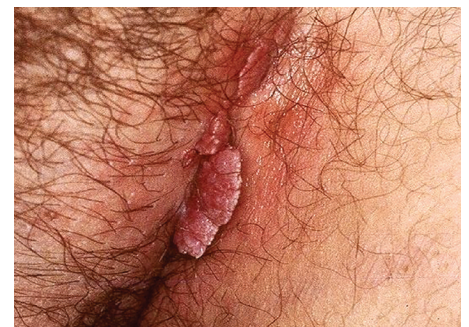
Obr. 4. Erozivní lichen planus vulvy a vagíny (zdroj: https://obgyn.onlinelibrary.wiley.com/doi/10.3109/00016341003681231 )